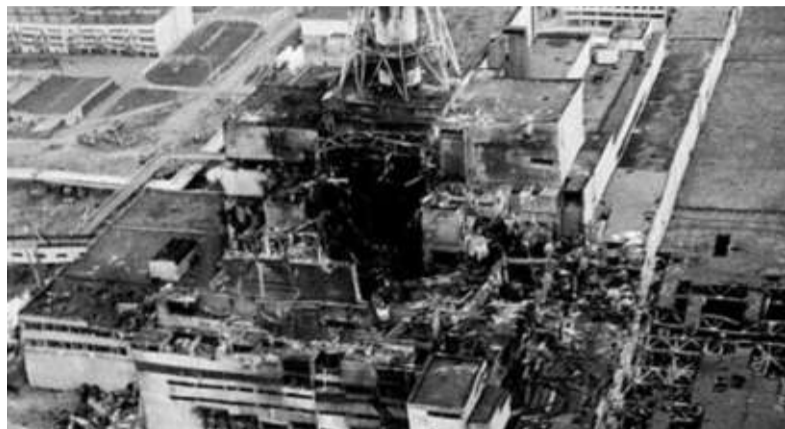
Il reattore nucleare numero 4 di Chernobyl esplosa.