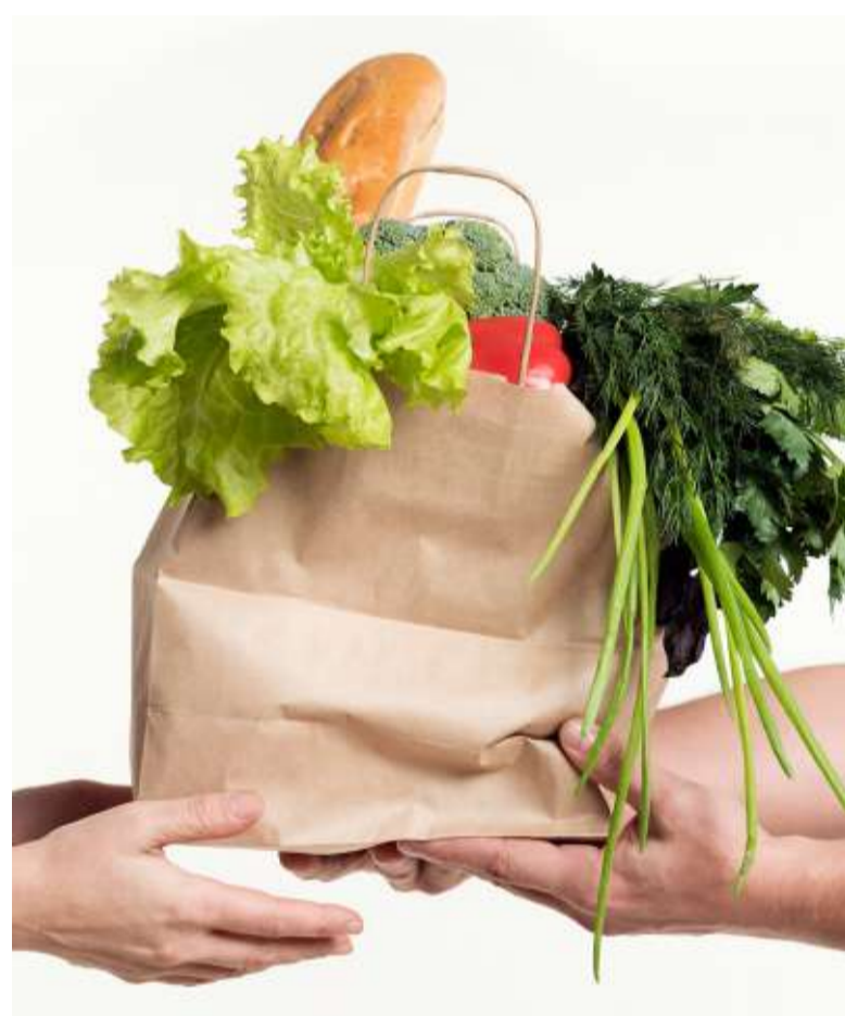
Tra gli ambiti di intervento c'è anche la distribuzione di cibo.

Il CISOM è presente in Toscana con 11 raggruppamenti: per informazioni sulle loro attività e sui progetti locali, per contatti e delucidazioni su come diventare un volontario, CISOM visitare il sito www.cisom.org .