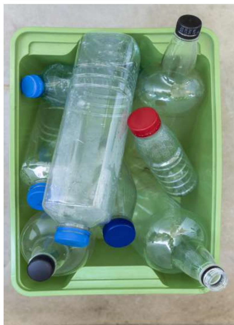
Con il fontanello si ridurrà il consumo di plastica.