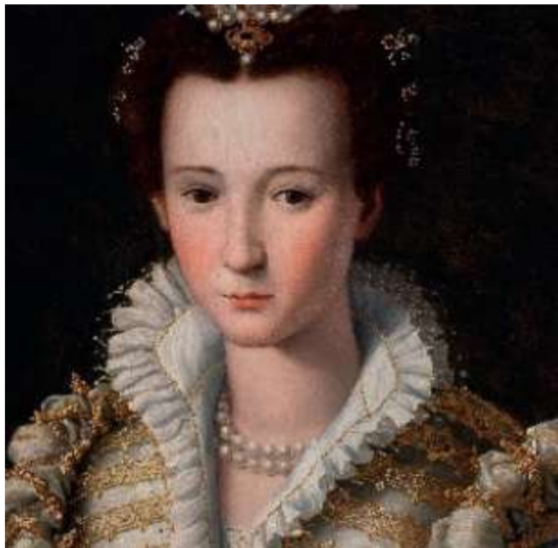
Il restauro è stato possibile grazie al progetto MyPoggio.