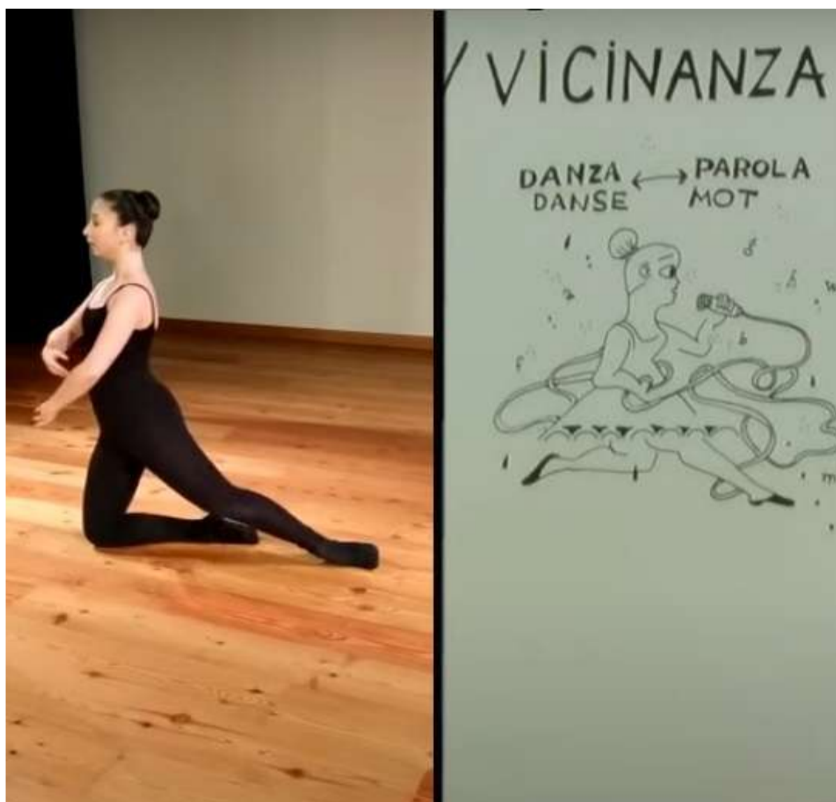
Un momento del video "De vulgari eloquentia..." cui hanno partecipato le nostre studentesse.

sono alunni italiani. Tutti erano confinati nelle proprie case. Le loro differenze sono state le strade che i loro linguaggi hanno percorso: francese, italiano, voce, disegno, musica, danza, grafica, scrittura si sono incontrati in questo spazio e in questo tempo dove la tecnica ha permesso alla loro immaginazione di esprimersi in coro. Oltre l'isolamento, oltre l'epidemia circostante propongono una riflessione a tutto tondo sull'eloquentia 700 anni dopo la nascita di Dante.