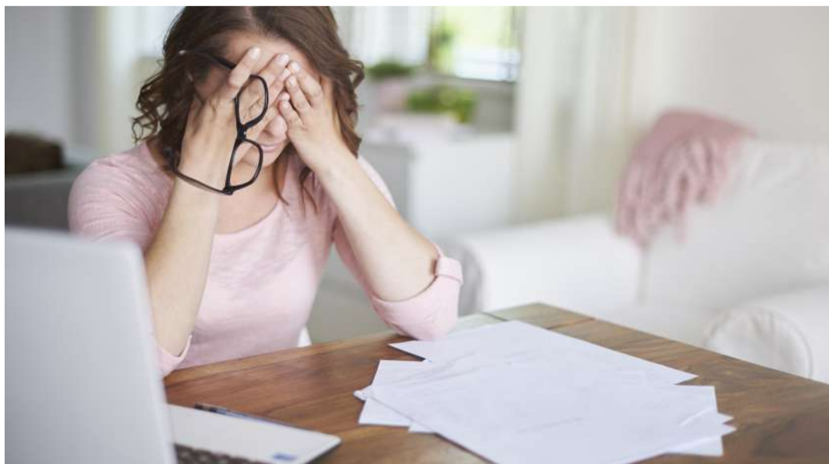
Uno psicologo sarà presto a disposizione dei ragazzi per aiutarli a gestire eventuali problemi.